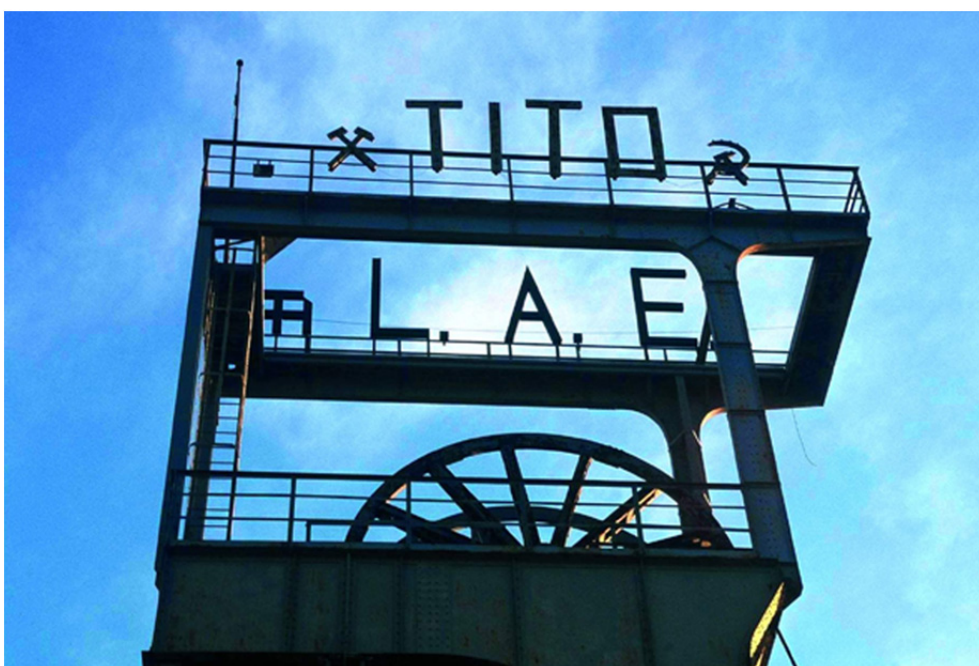
Foto 2: L.A.E. 12. rujna 1998. u sklopu bivšeg industrijskog kompleksa labinskog rudnika otvara Kulturni centar Lamparna (KuC) kao prvi nezavisni i međunarodni kulturni centar u RH

četiristogodišnju tradiciju rudarenja transformacijom industrijsko-povijesne baštine u avangardni umjetnički projekt, kulturno-turističku atrakciju od svjetskog značaja, tj. stvaranje pravog grada 150 m ispod površine zemlje – u podzemnim halama i tunelima, isklesanim u živoj stijeni, koji spajaju Labin, Rašu, Plomin i Rabac, i to s ulicama, barovima, galerijama, bazenima, igralištima za djecu, trgovinama, restoranima, Muzejom rudarstva i industrije Istre. Ukratko, projekt Podzemni grad XXI . formalno je započet 1998. otvaranjem Kulturnog centra Lamparna – budućega ulaza u Podzemni grad, tj. čekaonici za lift koji će nas odvesti 150 m ispod površine zemlje.