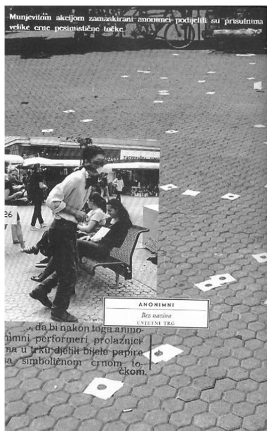
Foto 5: Anonimni [Igor Grubić]: Bez naziva; Knjiga i društvo – 22% (10. srpnja 1998., Cvjetni trg, Zagreb) kao zajednički istup-reakcija tridesetak umjetnika zbog PDV-a na knjige. Prva kolektivna art -akcija u RH

istup-reakcija tridesetak umjetnika zbog PDV-a na knjige. Bila je to ujedno prva kolektivna art -akcija u RH.