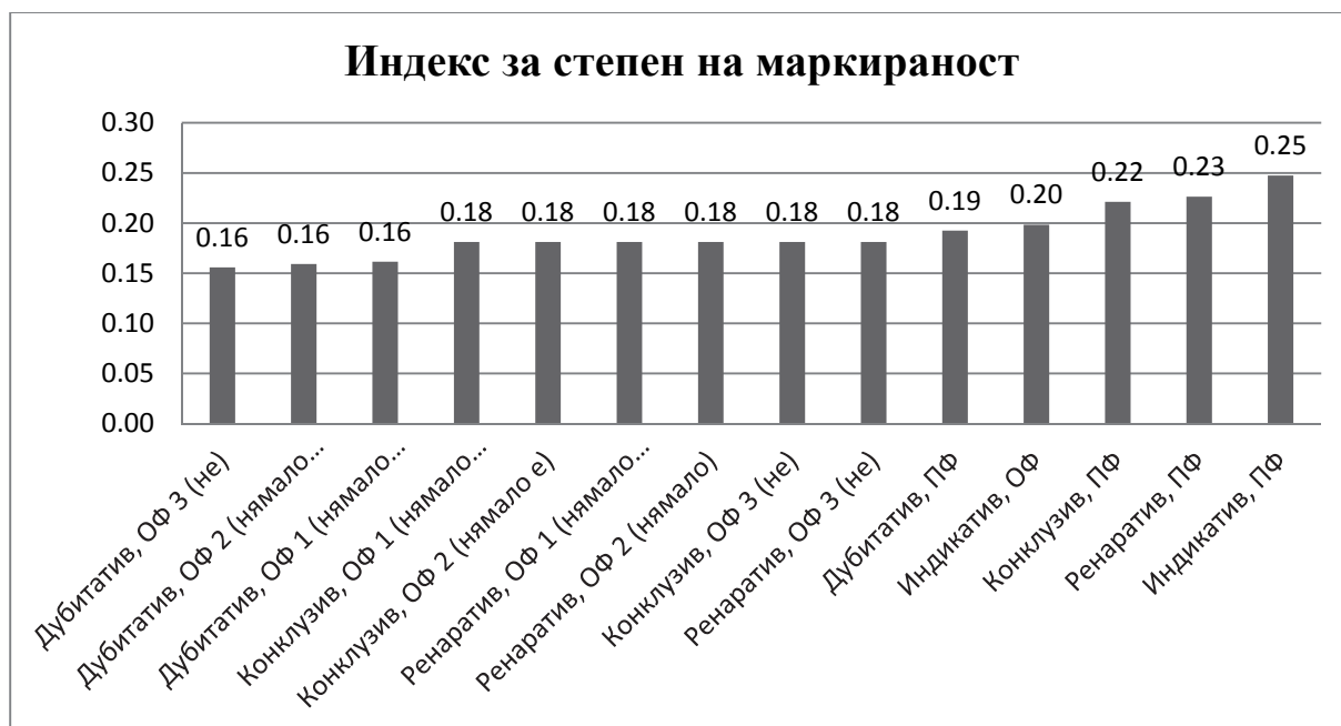
Графика 6. Йерархия на 14-те евиденциални микропарадигми според индекса за степен на маркираност на член от парадигмата

Степента на маркираност е индекс, показващ средното разпределение на положителните семантични товари върху членовете на една парадигма \left(\mu = \frac{U}{p}\right) . Подобно отношение е показателно за богатството на парадигмата, а то подрежда наблюдаваните 14 евиденциални микропарадигми по следния начин на Граф. 6.