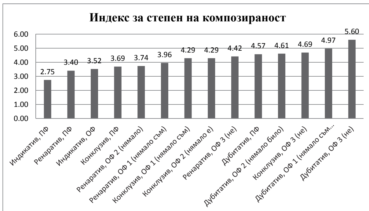
Графика 5. Йерархия на 14-те евиденциални микропарадигми според индекса за степен на композираност

По стойностите на индекса за степен на композираност, която се увеличава при българския глагол в процеса на развой към аналитизъм, 14-те евиденциални микропарадигми също образуват йерархия, видна на Граф. 5.