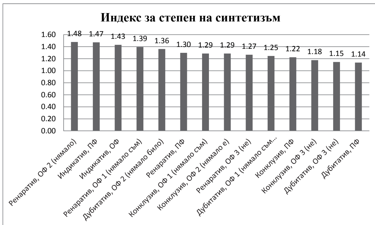
Графика 4. Йерархия на 14-те евиденциални микропарадигми според индекса за степен на синтетизъм

Стойностите на индекса за синтетизъм, представляващ отношението между броя на микрословоформите към броя на положителните семантични товари \left(s = \frac{p}{\mu}\right) , подрежда 14-те евиденциални микропарадигми по начин, виден на Граф. 4.