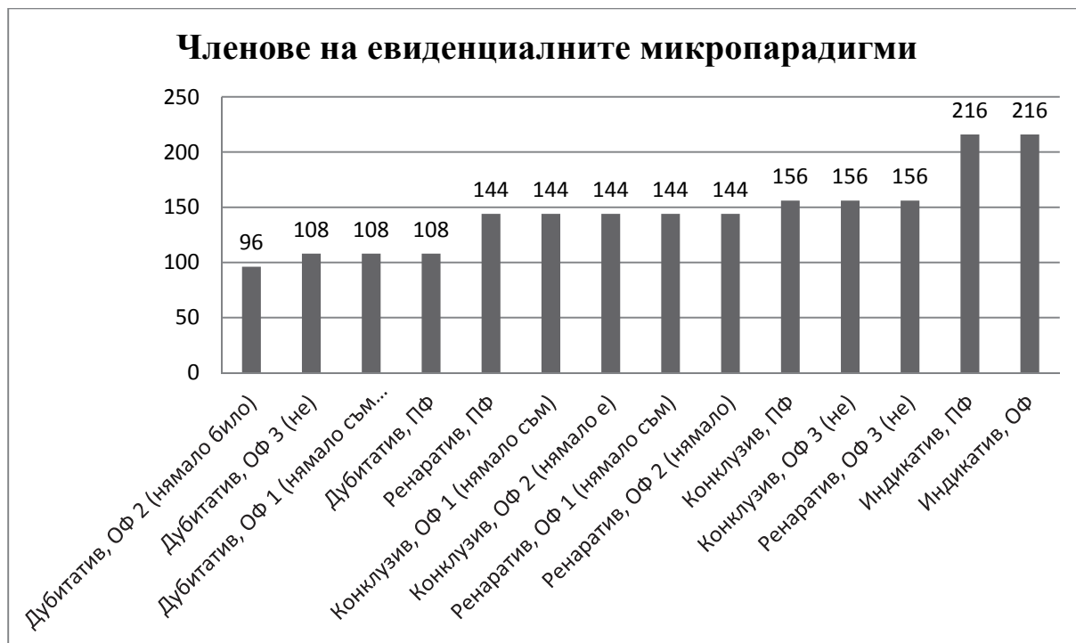
Графика 1. Брой на членовете на 14-те евиденциални микропарадигми

Преди да бъдат изчислени и анализирани 4-те интересувачи ни типологически индекса, е необходимо да се съпоставят 14-те евиденциални микропарадигми по броя на членовете (Граф. 1) и по броя на микрословоформите (Граф. 2), защото данните за тях участват в изчисляването на някои от типологическите индекси и обясняват стойностите им.