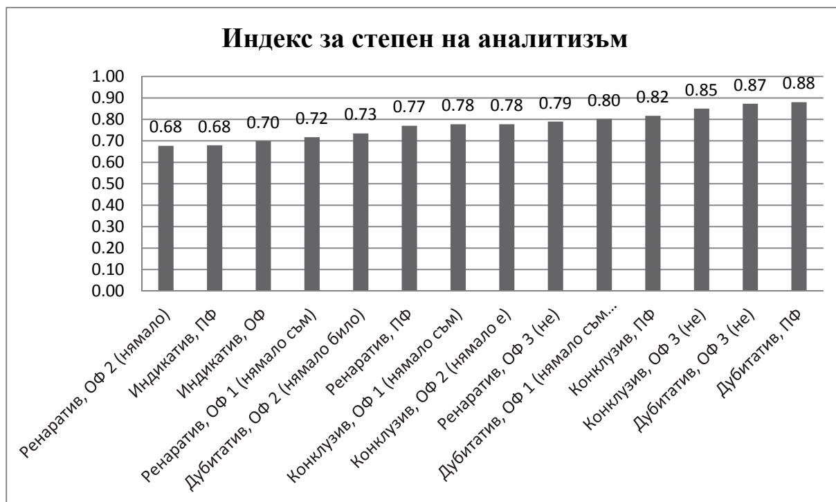
Графика 3. Йерархия на 14-те евиденциални микропарадигми според индекса за степен на аналитизъм

числява индексът за аналитизъм \left(a = \frac{\mu}{p}\right) на 14-те евиденциални микропарадигми. На Граф. 3 е представена йерархията на тези микропарадигми по степен на аналитизъм.